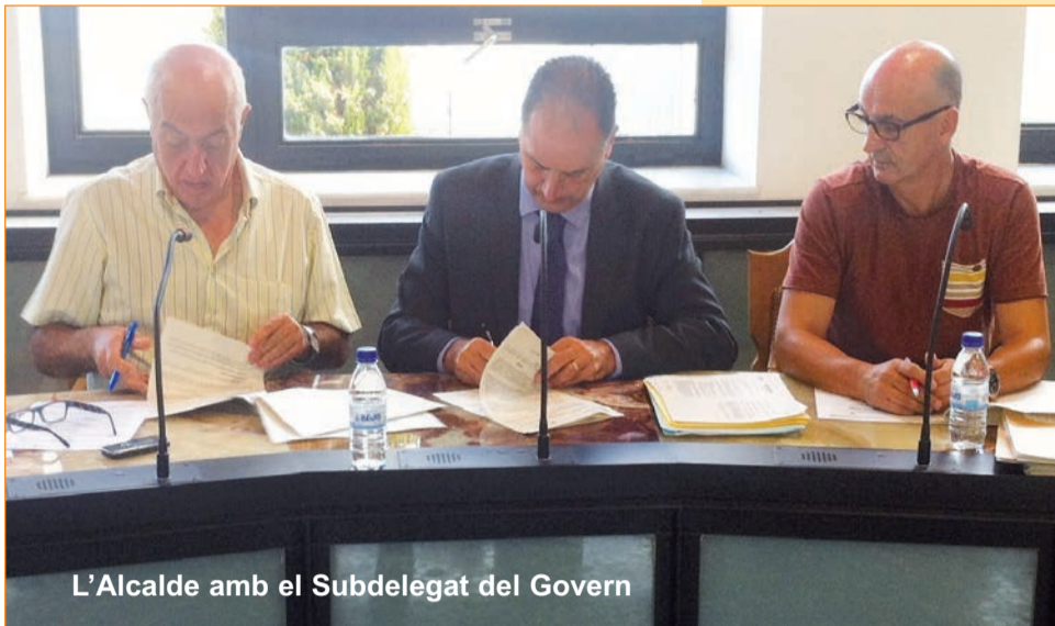
L'Alcalde amb el Subdelegat del Govern