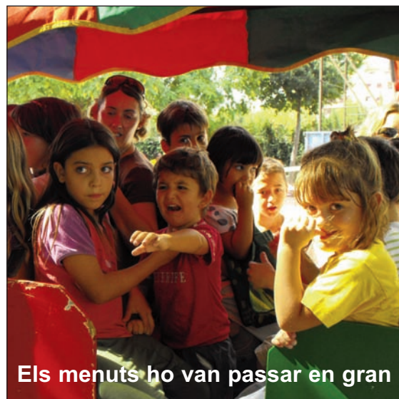
Els menuts ho van passar en gran