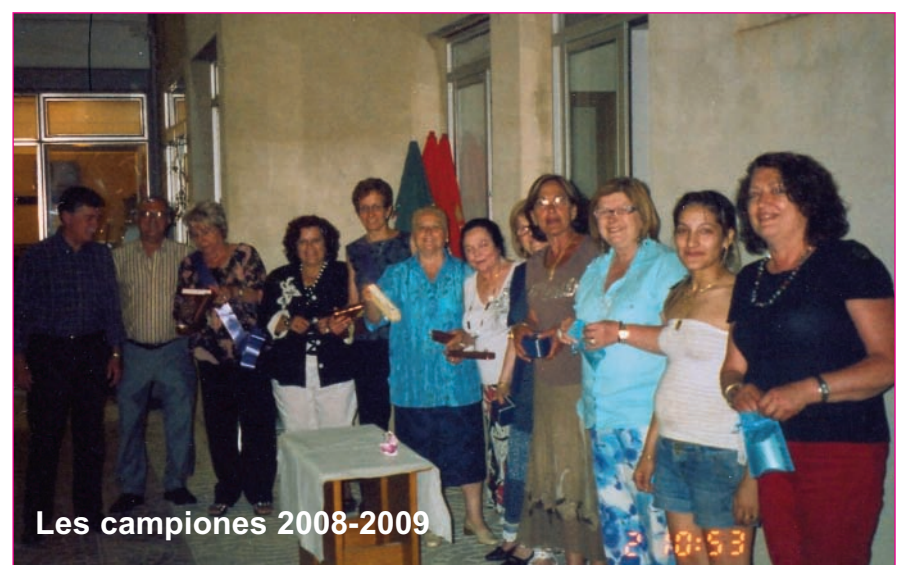
Les campiones 2008-2009