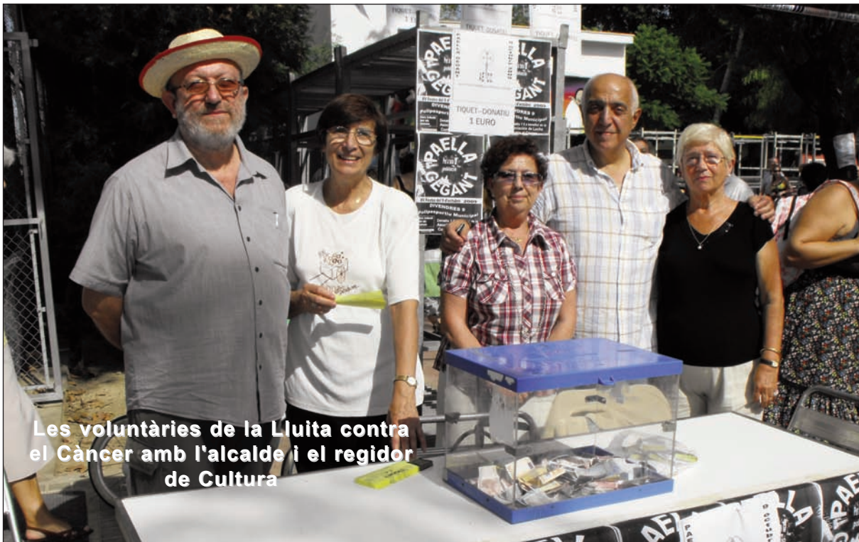
Les voluntàries de la Lluita contra el Càncer amb l'alcalde i el regidor de Cultura

L'Ajuntament de Massanassa va organitzar la Paella Gegant que tots els anys s'ofereix als veïns i veïnes de Massanassa amb motiu de la Festa del 9 d'octubre.