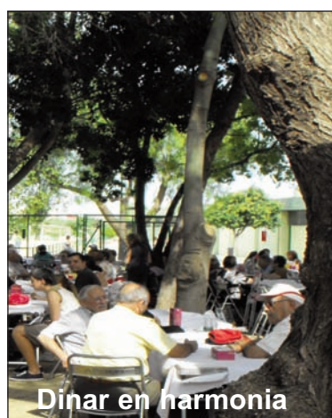
Dinar en harmonia