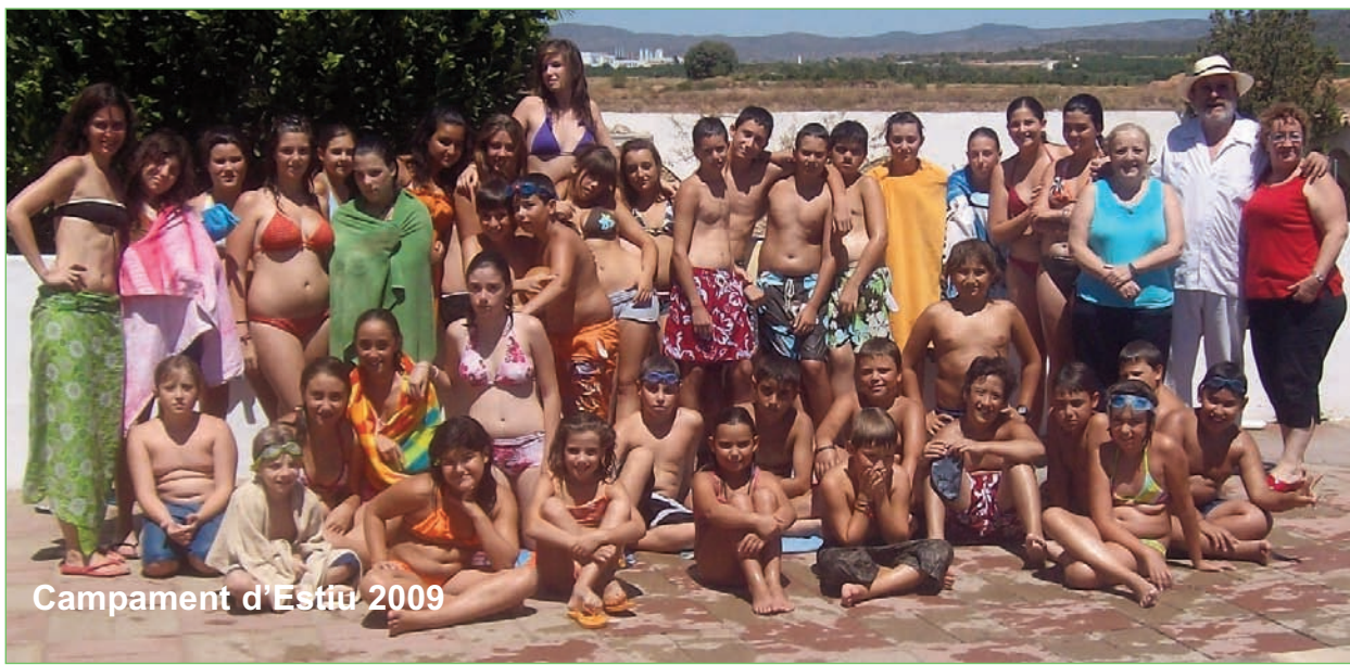
Campament d'Estiu 2009