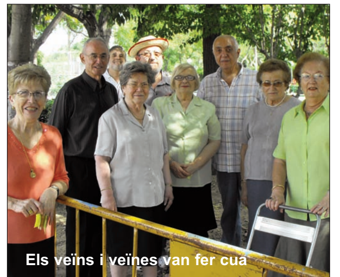
Els veïns i veïnes van fer cua