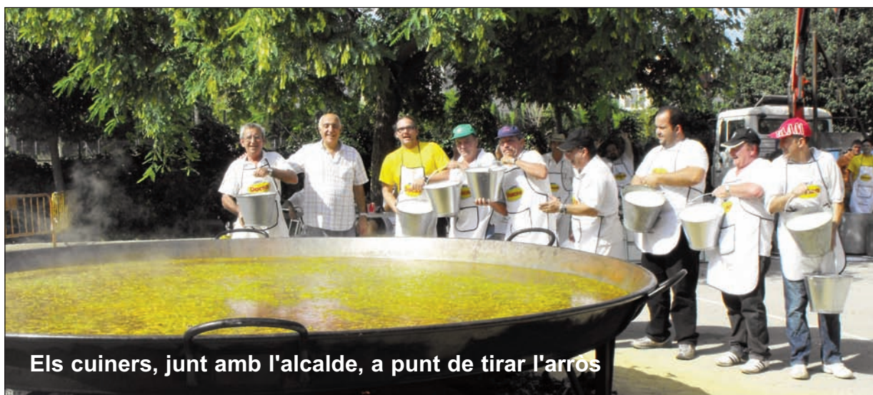
Els cuiners, junt amb l'alcalde, a punt de tirar l'arros

Però l'estrella va ser la paella gegant que com sempre va estar molt bona. Els cuiners de la Associació de Clavaris del Crist de la Fé, de Mislata es van afinar en la preparació d'este plat tradicional del que cuinaren 2000 racions que varen ser servides en la seua totalitat als assistents a esta festa.