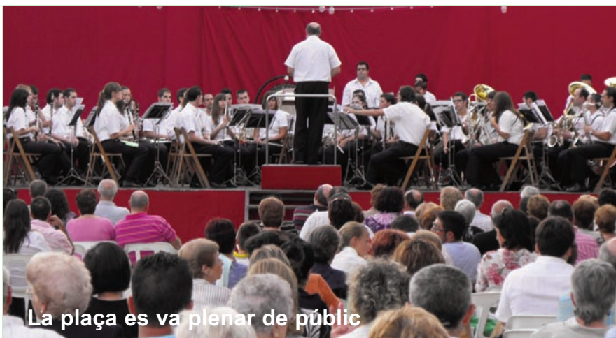
La plaça es va plenar de públic