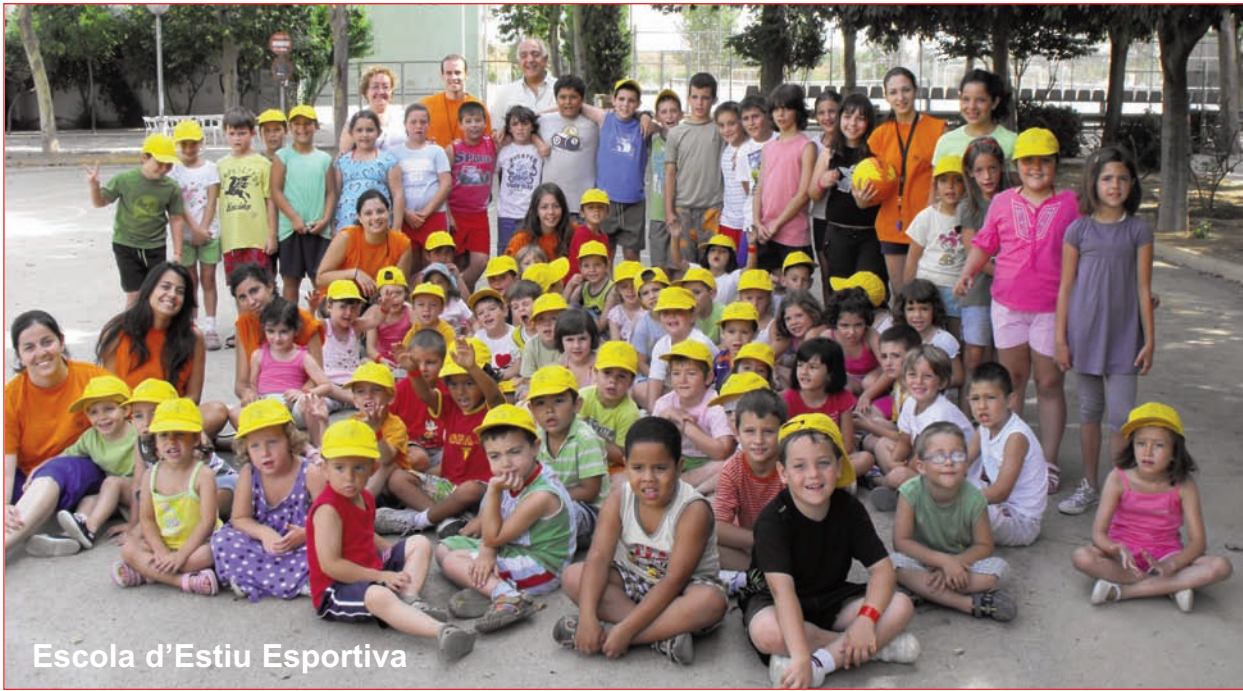
Escola d'Estiu Esportiva