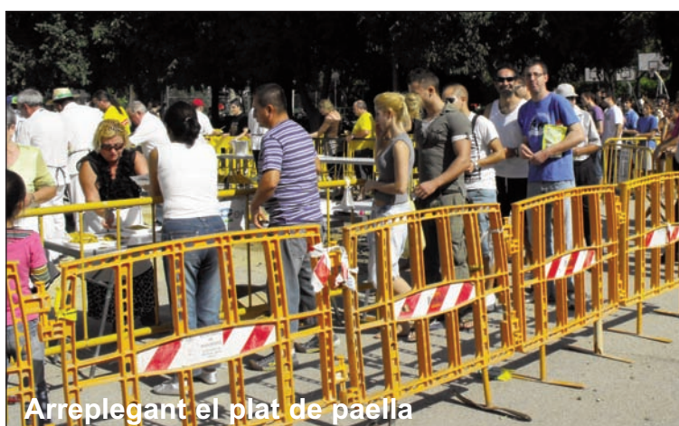
Arreplegant el plat de paella