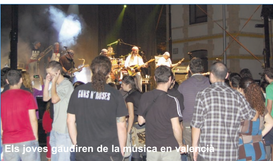
Els joves gaudiren de la música en valencià

La banda del CIM ha oferit el tradicional concert del 9 d'Octubre en la plaça de les Escoles Velles. En el recital també va participar la banda de l'Ateneu de Sueca.