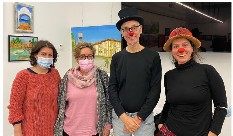
Clownferència: a més igualtat, més llibertat i més felicitat