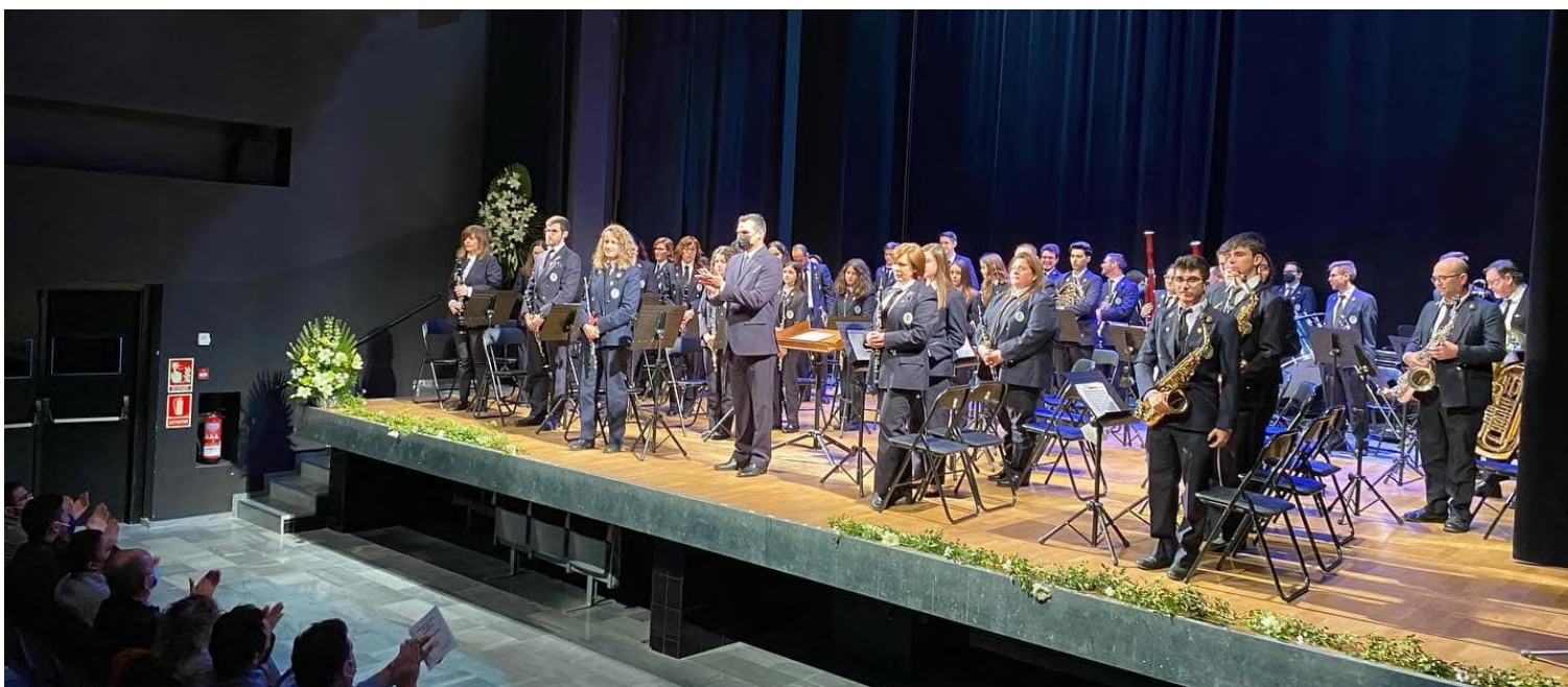
Actuació del Centre Instructiu i Musical de Massanassa