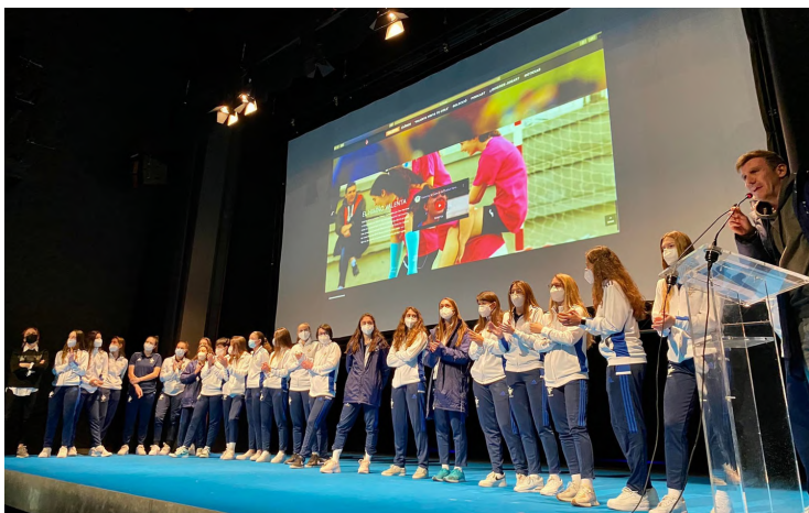
Promoció del futbol femení