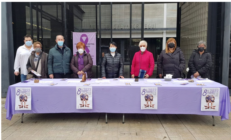
Taula amb material de sensibilització del 8M per l'Associació de Dones Progressistes