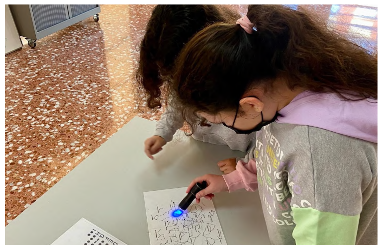
Activitat escolar: Atrapades en la Ciència