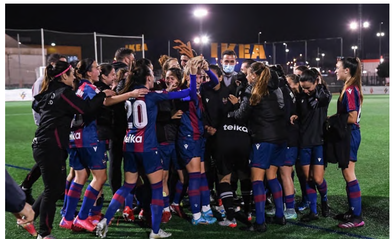
III Triangular de la Setmana Valenta Sub-21