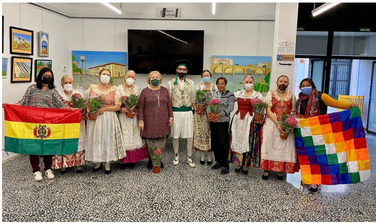
Grup de Danses Gent Gran i Ser Dona al Sud