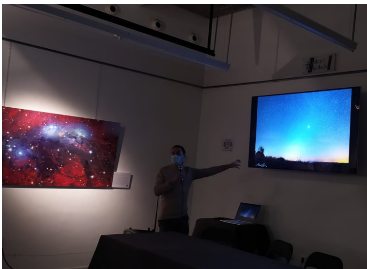
Fotografiar lo invisible, de Vicent Peris