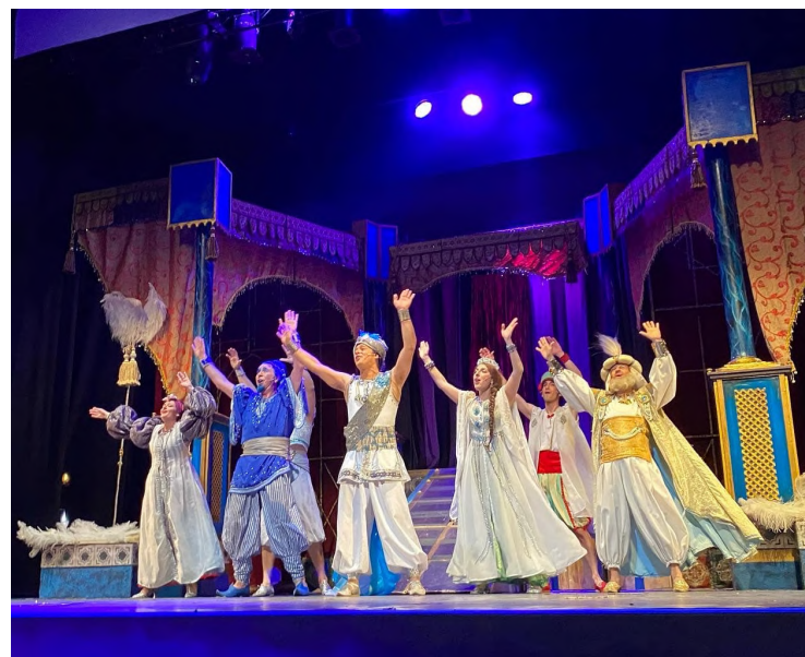
Aladín: un musical genial