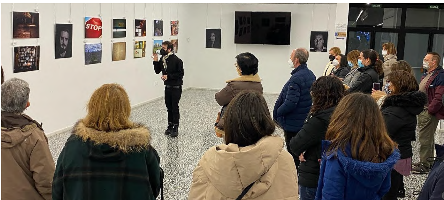
Dislexia: el valor de lo distinto, de Jonathan Sendra