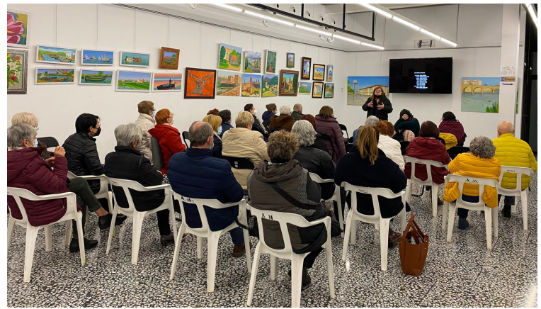
Cinefòrum: Pago Justo