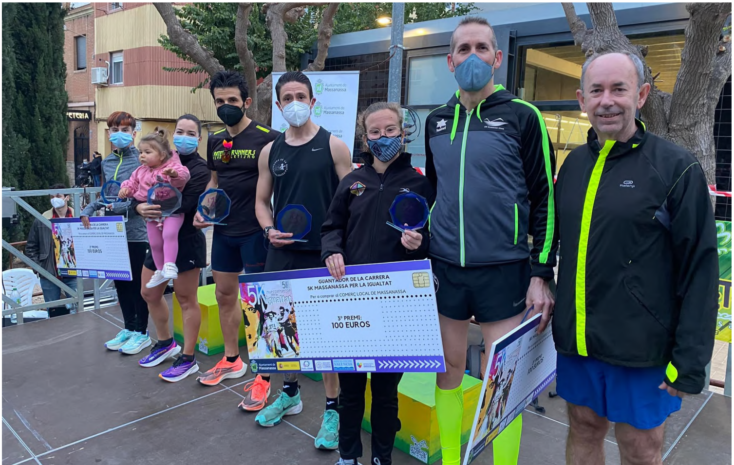
Caminada i Carrera 5K per la Igualtat