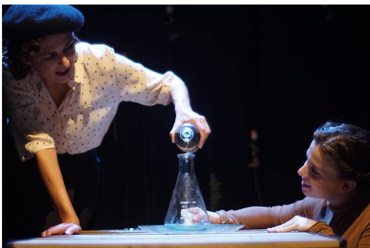
Cartes a Curie