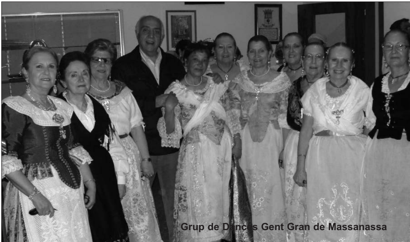
Grup de Dances Gent Gran de Massanassa